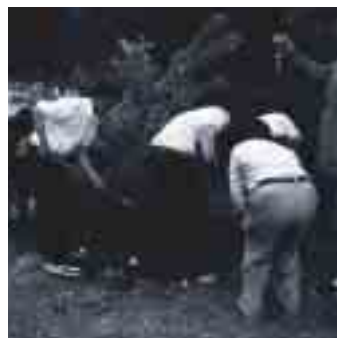
十津川校の生徒が顕彰碑のそばに、交流の証として世間桜の幼木を植樹しました。