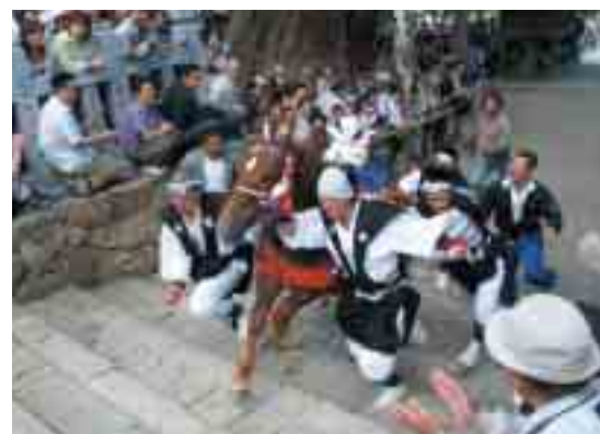
玉若酢命神社 御霊会風流