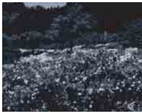
花と緑のコントラストが、とても綺麗です。