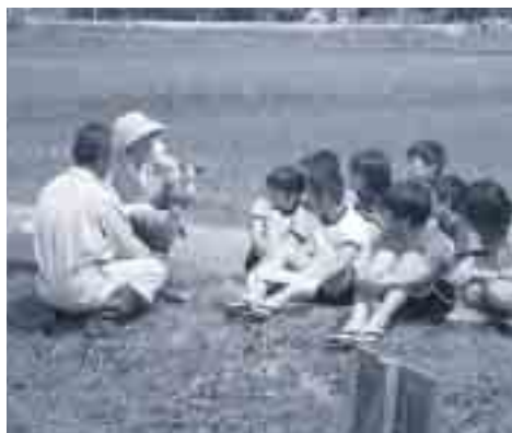
秋には豊作になるといいですね。