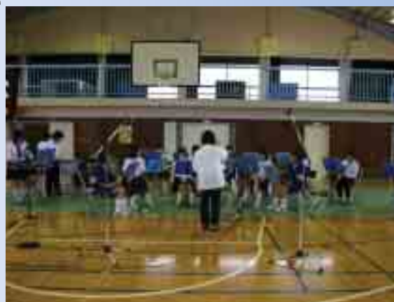
西郷中学校吹奏楽部の皆さん