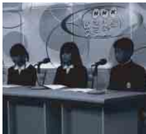
緊張しているキャスター3人

隠岐島文化会館にNHKの放送スタジオがやってきました。キャスター、リポーター、カメラマン、各ディレクターなど、スタッフは全て隠岐の島町の小学生が担当し、自分たちで番組の制作、収録を行いました。番組名は「隠岐を伝えよう、NHK放送体験クラブ移動スタジオ」。