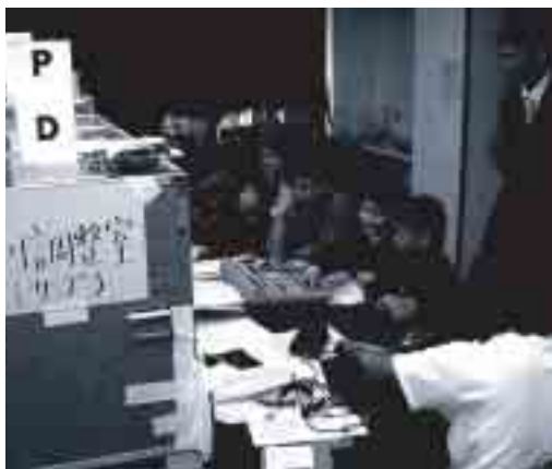
初めて触る機材にわくわく

これは小学生に番組作りを通じて放送の仕組みと役割について、楽しみながら学んでもらうことを目的としたNHK主催のイベントで、五月十七日から十九日にかけて、西郷小、中条小、有木小、今津小、加茂小、中村小、布施小、那久小の五、六年生が参加しました。