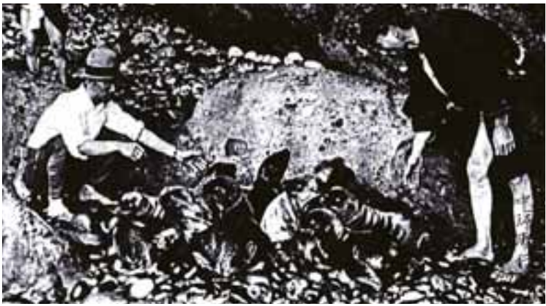
竹島でのアシカ猟 生け捕りにしたアシカの仔

先月号の特集では、竹島の領土問題のあらましを紹介しました。しかし、国際法や政治の説明などが中心だったため、やや実感のわきにくい内容だったかもしれません。そこで今回は、「隠岐の島と竹島の関わり」というテーマで、ふたりの方のお話をつかがながらその歴史を紹介します。