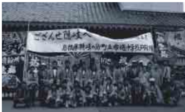
記念撮影 おつかれさま

また、パンフレットの配布やアワビ、サザエ、黒曜石、ひおうぎ貝、魚拓などを展示し、隠岐観光の説明を行いました。