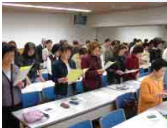
女性の力を結集して!

「隠岐島後婦人会連絡協議会」組織を再編し 隠岐の島町婦人会結成 五月二十八日(土)、会員の資質を高め相互の親睦と生活の向上を目指すこと、地域社会の福祉増進に努めることを目的として、隠岐の島町婦人会が設立されました。旧町村の婦人会を、それぞれ支部として結成されています。 事業計画では、各研修や、環境活動が予定されました。環境活動の主なもの、本年から三年間県の女性ファンドの助成を受けて実施する花の里作り、「ゴミの減量のためのマイバッグ運動」の推進が盛り込まれています。 特にこのマイバッグ運動は、環境省もシシ袋の有料化を検討している中において、会員のみでなく、消費者全体に広げていくよう活動を進めていくこととしています。