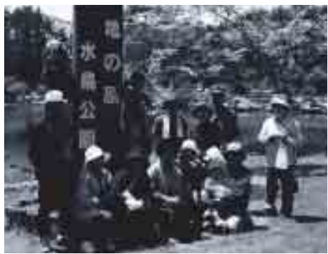
健康ウォーク参加者の皆さん。