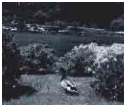
亀の原といえばアイガモ。今日はアイガモもお花見です。

PR活動は、二回に分けて行われ、一回目は緊張や動揺していた生徒達も、二回目は納得いく活動が出来ました。隠岐の島町で一番小さな中学校の生徒達ですが、貴重な経験を、大きな自身がついたのではないのでしょうか。今後の学校生活でも、たくましく育ってほしいものです。