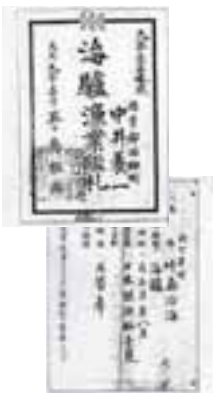
竹島海産物(アシカ)漁業鑑札(許可証) 写真は 大正9年のもの